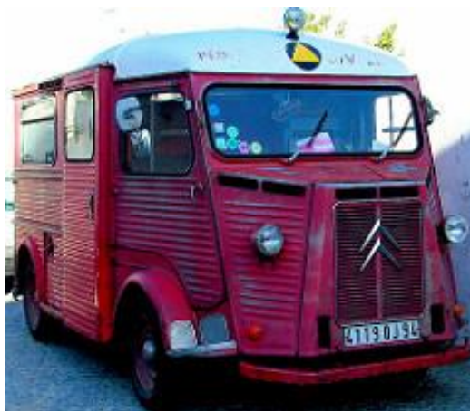
Photo Le Citroën Type HY par Pedro Ribeiro Simões/photos/pedrosimoes7/ (CC BY 2.0)

Croix-Rouge vaudoise, Rue Beau-Séjour 9-13, 1002 Lausanne